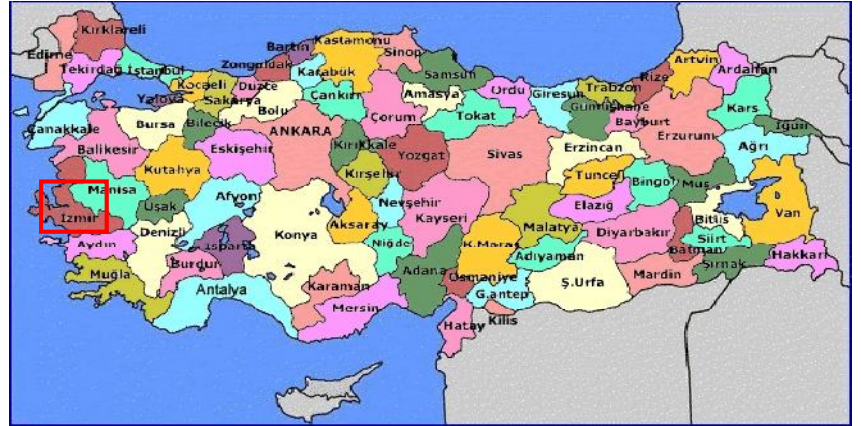
Harita 1 - İzmir'in Konumu

Ege kıyı bölgesinin tipik bir örneği olan İzmir, kuzeyde Madra Dağları, güneyde Kuşadası Körfezi, batıda Çeşme Yarımadası'nın Teke Burnu, doğuda ise Aydın–Manisa il sınırları ile çevrilmiş, 11.973 km 2 'lik bir alana yayılmıştır. İzmir, Ege Bölgesi'nin en büyük, ülkemizin de üçüncü büyük ilidir.